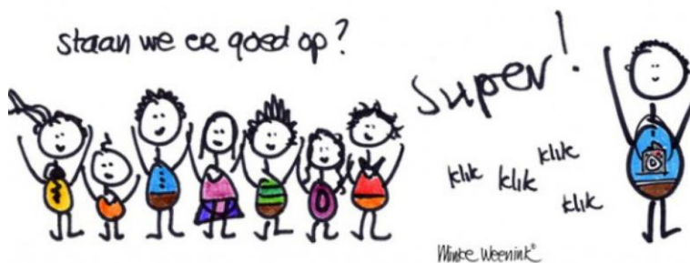
Foto Koch komt dit jaar 2 dagen op onze school, te weten op dinsdag 14 én woensdag 15 april 2020 om de schoolfoto's maken. Dit vanwege de vele leerlingen op onze school lukt het niet meer om dit op 1 dag te doen. U krijgt nog bericht van ons, op welke dag uw kind aan de beurt is.